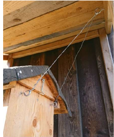
Seitlich je 2 Ösen einschrauben für Aufhängung mit Draht