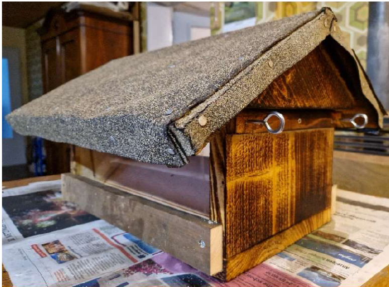
Dachpappe fürs Dach: 55x53 cm